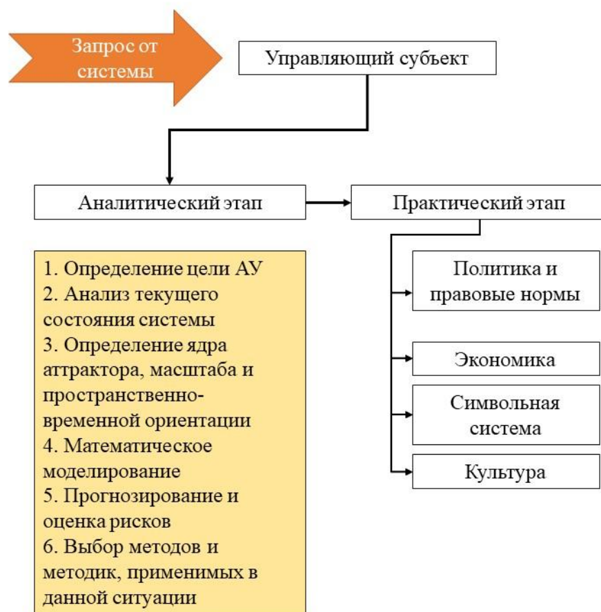
Модель применения аттрактивного управления (создано автором)

Кроме того, в параграфе рассматривается частный случай применения аттрактивного управления в стабильной, далёкой от точки бифуркации системе. Социокультурные системы часто находятся в равновесии, что затрудняет реализацию изменений через аттрактор, так как он формируется преимущественно в условиях неустойчивости. Поэтому возникает необходимость выяснить, как управляющий субъект может искусственно задать параметры порядка и сформировать аттрактор даже в стабильной среде.